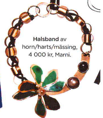
Halsband av horn/harts/mässing, 4 000 kr, Marni.