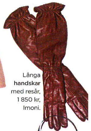
Långa handskar med resår, 1 850 kr, Imoni.