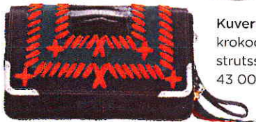
Kuvertväska av krokodil- och strutsskinn, 43 000 kr, Luella.