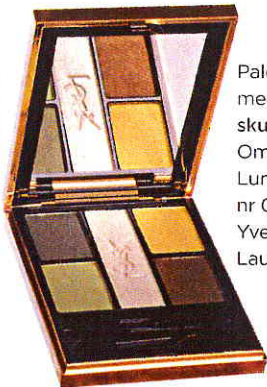
Palett med ögonskuggor, Ombres 5 Lumières nr 06, 485 kr, Yves Saint Laurent.