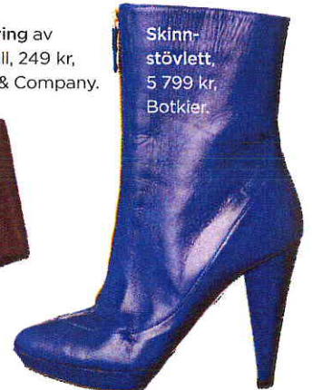
Skinnstöylett, 5 799 kr, Botkier.