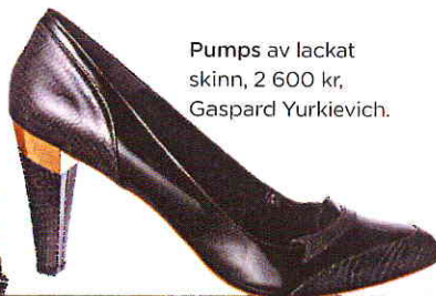
Pumps av lackat skinn, 2 600 kr, Gaspard Yurkievich.