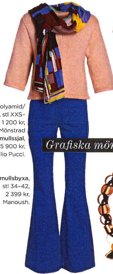
Kofta av polyamid/angora/ull, stl XXS-XXL, 1 200 kr, InWear. Mönstrad bomullssjal, 5 900 kr, Emilio Pucci.