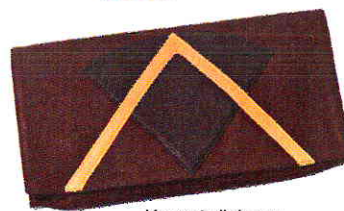
Kuvertväska av skinn, 3 475 kr, Camilla Norrback.