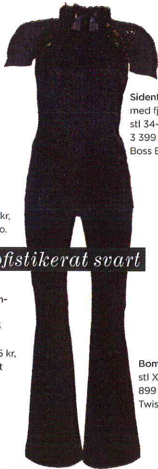
Sidentopp med fjädrar, stl 34-42, 3 399 kr, Boss Black.